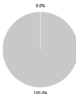
2. Alignement des investissements sur la taxonomie, hors obligations souveraines*

■ Alignés sur la taxonomie (hors gaz fossile et nucléaire) ■ Non alignés sur la taxonomie